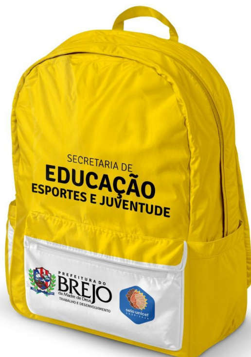
Figura 2- Modelo de Mochila

(imagens meramente ilustrativas, devendo seguir a descrição dos itens).