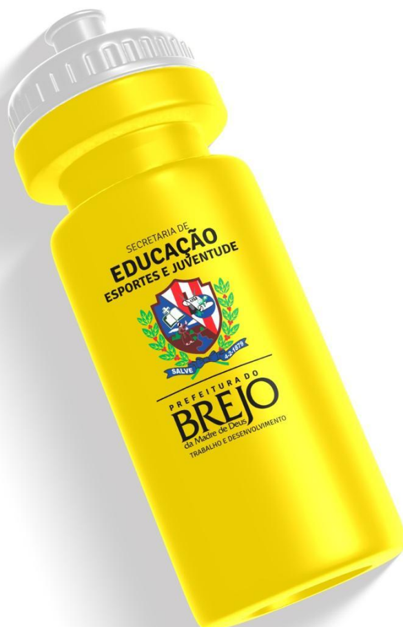
Figura 3 - Modelo de Garrafa Squeeze

BREJO da Madre de Deus TRABALHO E DESENVOLVIMENTO