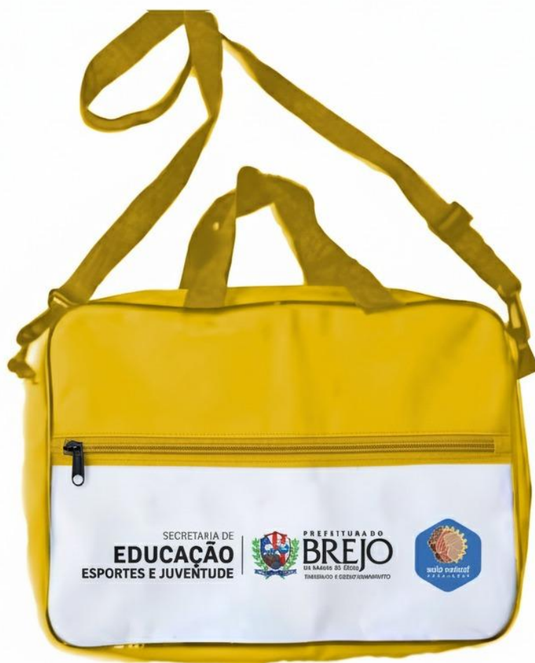
Figura 5 - Modelo de Pasta

da Madre de Deus TRABALHO E DESENVOLVIMENTO