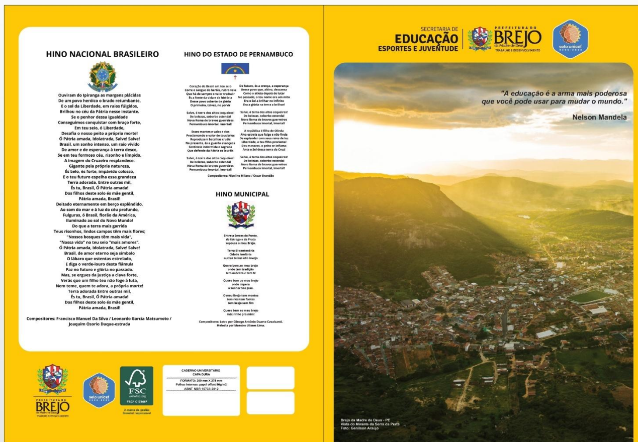
Figura 6 - Modelo de Caderno

Obs. O demais modelos dos cadernos e itens personalizados seguem em anexo.