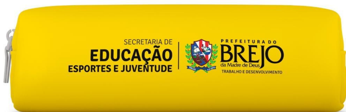
Figura 4 - Modelo de Estojo

PREFEITURA DO BREJO da Madre de Deus TRABALHO E DESENVOLVIMENTO